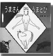
水野 翠／著 小峯書店

絵もユニークですし、必ずといっていいほどオノマトペ（擬態語・擬音語）が文中に入っているので子供たちが喜びそうですね。