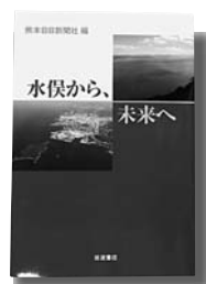
熊本日日新聞社／編 岩波書店