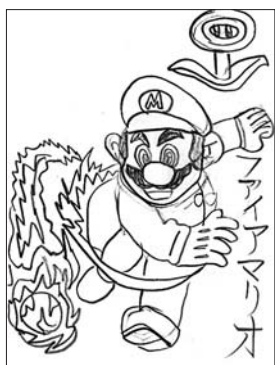
馬水 前田歩惟 10歳