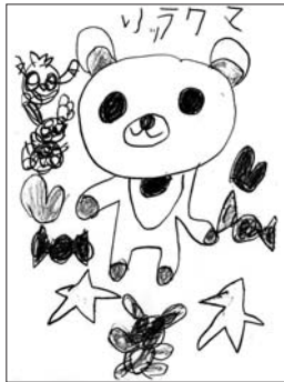
惣領 水村鈴菜 5歳