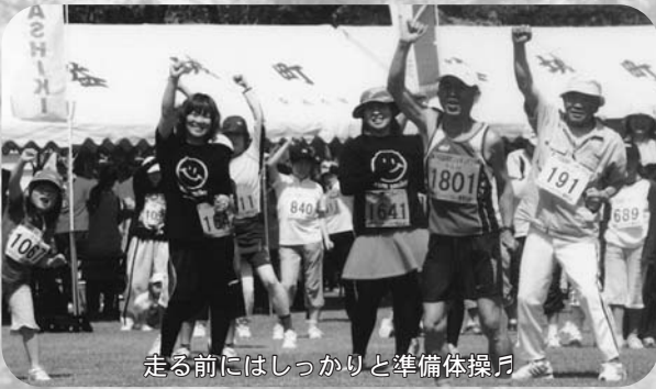
走る前にはしっかりと準備体操