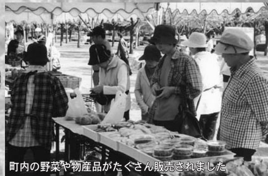
町内の野菜や物産品がたぐさん販売されました

大会の締めくくりはお楽しみ抽選会。今年もさまざまな賞品が用意され、会場のあちこちで一喜一憂する光景が見られました。会場周辺のテントでは地元特産の農産物なども販売され、参加者たちは町内の農産物や特産品などを買い求めていました。