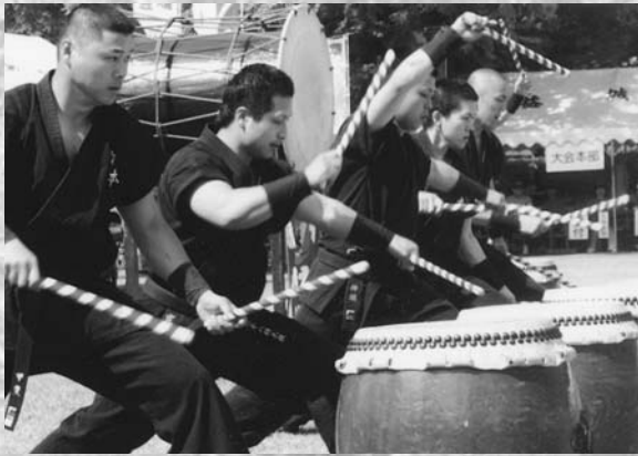
「熊本八特太鼓」の勇壮なばちさばきで開幕