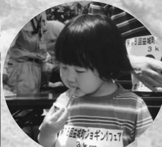
特産のスイカを「パクッ」