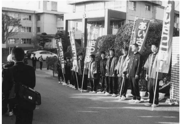
益城中学校のあいさつ運動