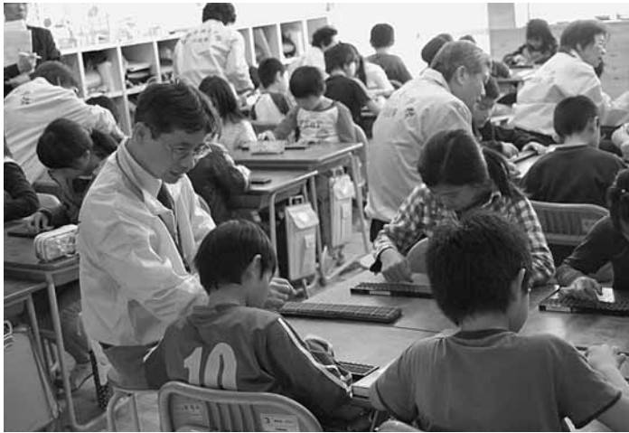
支援活動を行うボランティアの皆さん