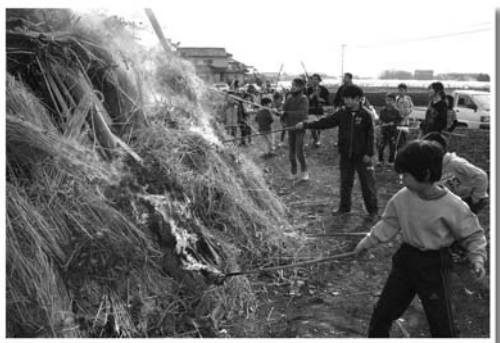
無病息災を願い子どもたちが一齐に着火 (1月14日、古閑のどんどや)

☒ ピカピカのランドセルを背負って笑顔いっぱいの子孫。一年生になるのが待ち遠しいみたいです。 田原 尾崎佐千子