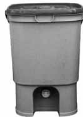
生ごみリサイクルボックス (BBスペシャル 屋内用 19 ℓ型)