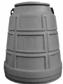
生ごみ処理容器ゴミキエール (HC-240 屋外用 240 ℓ型)