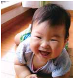
ふくしま かなな ちゃん 福島 環奈 ちゃん (惣領 1 町内)

わが家の自慢の 赤ちゃん を掲載しませんか？ (最初の誕生日を迎えるまで) 申し込みは役場秘書広報課広報係 ☎ 286-3111 / ☎ 203 まで