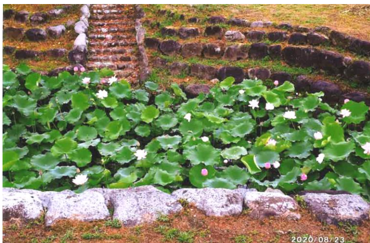
上の写真2枚は2020年8月に撮影されたもの。