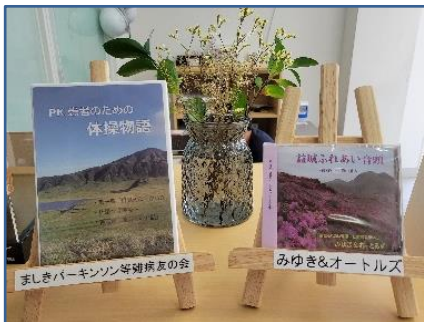
【写真左】ましきパーキンソン等難病友の会

まちサポでは登録団体が作成したCDやDVDを無料配布しています！ご希望の方は、お気軽にまちサポ窓口までお声掛けください☆★