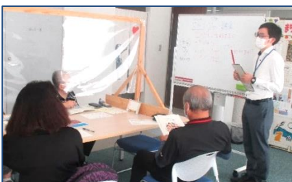
第2回スマートフォン講座