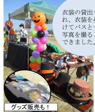
衣装の貸出も行われ、衣装を身に付けてバスと一緒に写真を撮ることができました。