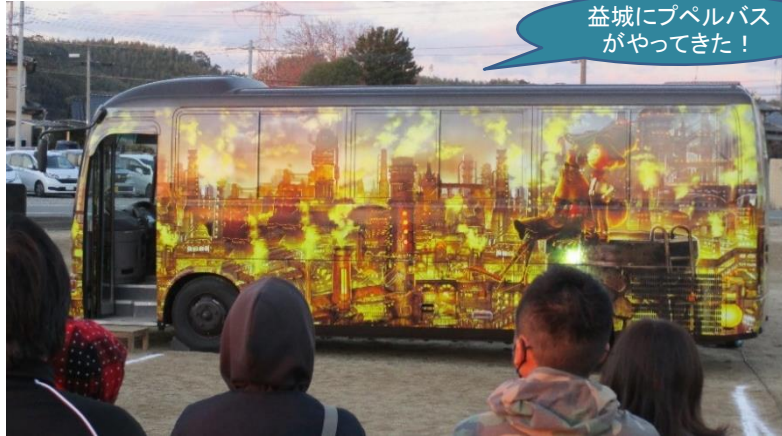
益城にプペルバスがやってきました!

11月27日(土)旧益城中央小学校跡地(益城復興事務所前広場)に『えんとつ町のプペル』の『プペルバス』がやってきました! まちサポの登録団体である『ツインズパーティ』が行う育児サークルに来ていた人の「プペルバスで熊本を元気にしたい」という思いに賛同し、マルシェ18店舗、ステージ8団体が集まり実現。見て、食べて、体験して、子どもから大人まで楽しめるイベントとなっていました!