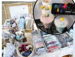
←クリスマスをイメージしたオリジナルバスボン作りができる『nijon & misare.Na』。オシャレな布で覆われたコロコロクリーナースタンドや眼鏡ケースなど、様々な布小物も販売されていました。