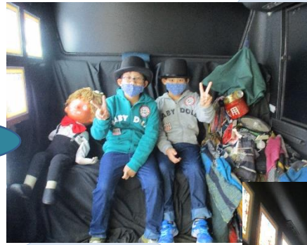
←バス車内では「光る絵本展」が鮮やかに輝いていました。登場人物になりきって写真を撮れるスペースもありました。