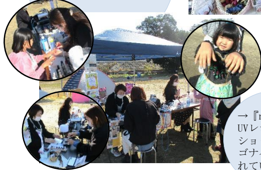
→『nijinooto』UVレジンワークショップや、オルゴナイトが販売されていました。