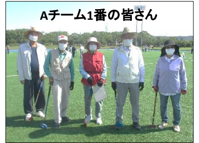
Aチーム1番の皆さん

↑芝生の様子を見ながらホールポストを目指す皆さん。ホールインした時の嬉しそうな表情がとても素敵でした！