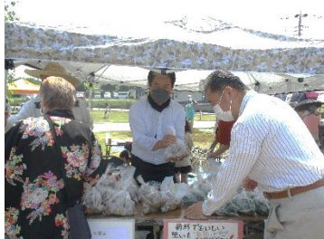
「NPO法人チーム安永」の野菜販売 「ひろやす荘」の職員による射的