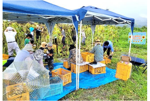
お子さんから高齢者の方まで、みんなで声を掛け合いながら協力して作業をしました。