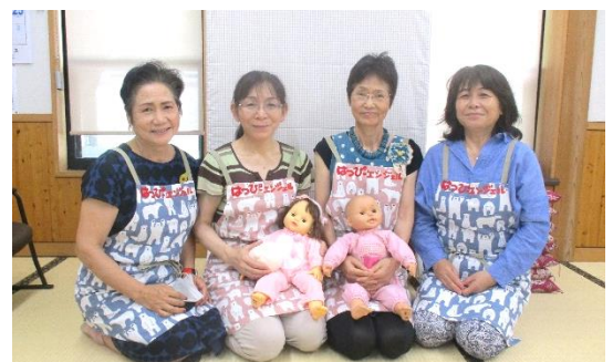
6月の学習会の時の“はっぴーエンジェル”のみなさん

4～5名程スタッフがいますので、赤ちゃんを寝かしつけたり、授乳をしたりしながら、お母さんたちもお子さんと一緒に安心して参加されていました。