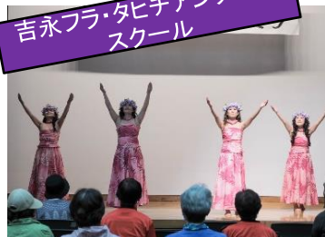
吉永フラ・タヒチアンダンススクール