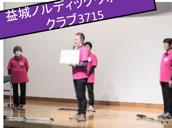
益城ノルディックウォーククラブ3715