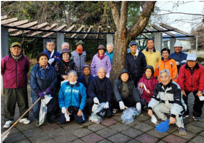
安永地区の老人クラブ連合会の皆さん

老人クラブ連合会の安永地区の皆さんは、毎月30日頃、安永神社と中央公園の清掃活動をしています。朝8時頃から、メンバーそれぞれ現地に到着次第開始。安永神社の清掃からスタートし、神社の清掃が終わったら中央公園へ移動して公園の清掃を始めます。この日は前日に風が強かったこともあり、落ち葉がたくさんありましたが、ブローヤ、神社や公園に置かれている竹ぼうきを使って、皆さんで協力し合い、午前9時半頃清掃が終わりました。竹ぼうきはメンバーの方の手作りだそうです。一番大変なのは、やはり秋の落ち葉の清掃とのこと。皆さんの定期的な清掃活動により、神社と公園がキレイに保たれていました。