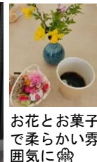
お花とお菓子で柔らかな雰囲気に☺