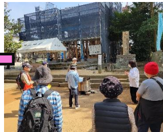
木山神宮へ行き、木山神宮の歴史と熊本地震からこれまでのお話も伺うことができました。拝殿は5月31日完成予定とのことです。