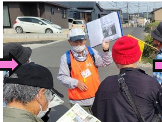
駐車場から北へ。熊本地震前や地震当時の資料と現在の街並みを見比べながら進みます。