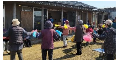
サロンドダンスと一緒に踊る参加者の皆さん

参加した元住民の方は「久しぶりに会えた人もいて、色々とお喋りができてよかった！」と懐かしみながら、最後のお茶会を笑顔で過ごされていました。