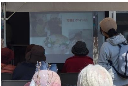
スライドショーの様子。最後は皆さんの笑顔で終わりました。