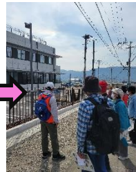
新庁舎の裏を通り『にじいろ』へ。完成目前の庁舎に皆さんワクワクです。『にじいろ』では、地域おこし協力隊の二人による施設の説明もありました。