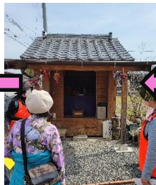
土場馬場の地藏堂を通り駐車場に戻りました。庄間の猿田彦大神