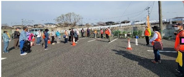
益城町町民グラウンド西側駐車場からスタート！今回は人数と道路整備による事故防止のため、二つのグループにわかれて歩きました。