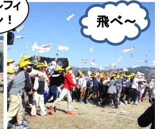
今日はルフィだモン！