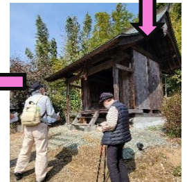
市ノ後の天神。パンフレットでは地震前の大きな鳥居があった姿を見ることができます。