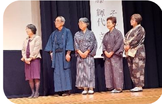
講演: 朗読劇団「鶴の子」の皆さん