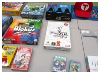
40種類以上の見たこともない世界中のゲームがズラリ