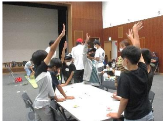
高学年生は初めて出会った他校の児童と意気投合