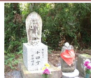
一丁地蔵さん(仏様)

平成になって、登山道入口の十四丁から新たに平成の一丁地蔵が作られました。その間に古い仏様も並んで立っています。