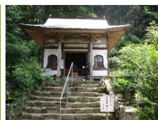
平安時代は九州随一の仏教道場だった常楽寺