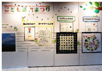
展示スペースには大きなボードゲームが

ボードゲームとは、ボード（盤）上で駒や札を動かすなどして競う遊技で、チェスや将棋なども含まれます。日頃はコンピューターゲームをやっている子ども達が、夢中になって遊んでいる姿を見て、ご家族の方も来て良かったと話されていました。