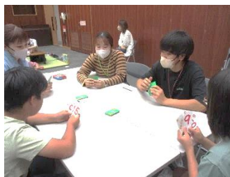
熊本県立大学のボランティアと勝負！