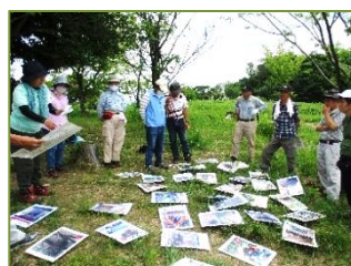
益城町歴史文化カルタ研究部によるカルタ取り