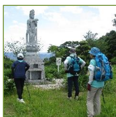
熊本地震で倒れたそうですが修復されました。