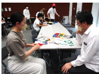
お子様がゲームをしている間、ご夫婦で真剣に対戦