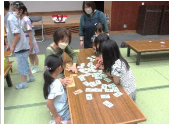
低学年生は図書館の司書さんと仲良く