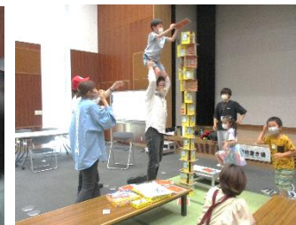
お父さんと協力して完全制覇！