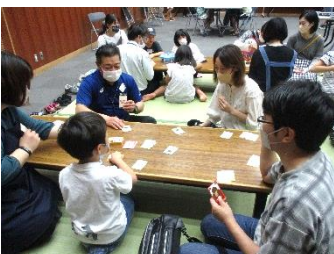
松本図書館長も飛び入り参加