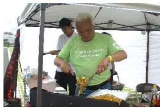
益城のお米で作られた保存食の試食