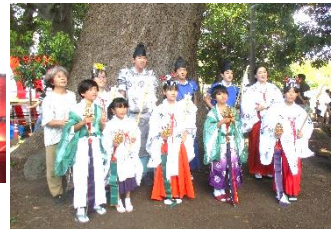
8月5日(土) 広崎権現神社で奉納の舞