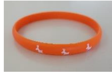
←講座の様子と配布されたパンフレットやオレンジリング。オレンジリングには認知症サポーターキャラバンのマスコット『ロバ隊長』がデザインされています。